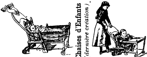
Chaises d'Enfants (dernière création)

Etoffes, laines, crins animal et végétal, duvets RÉPARATIONS DE MEUBLES