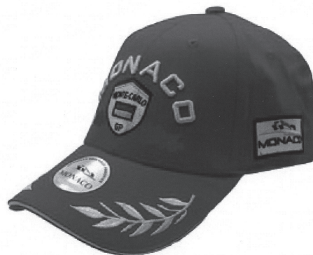
Vue côté droit