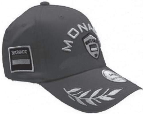
Vue côté gauche