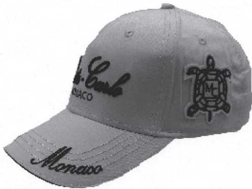
Vue côté droit