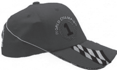
Vue côté gauche