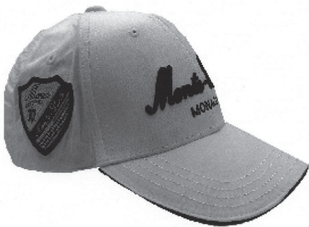
Vue côté gauche