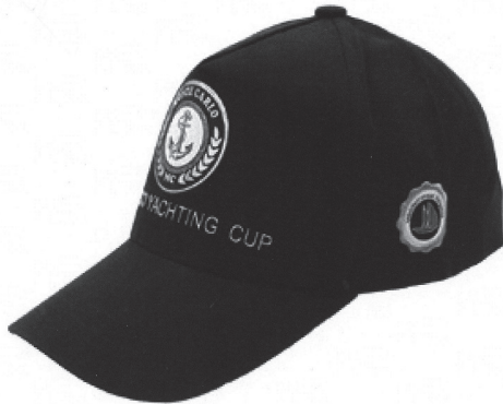
Vue côté droit