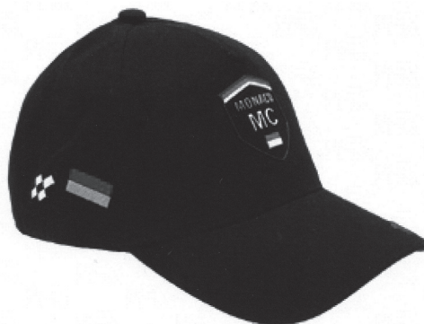
Vue côté gauche