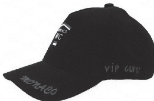
Vue côté droit