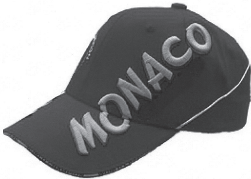
Vue côté droit