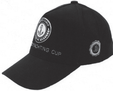
Vue côté gauche